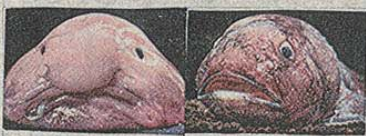
ニュウドウカジカ (陸上) ニュウドウカジカ (水中)