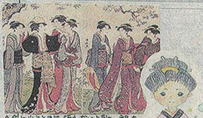
▲外に出るときは、お洒落な髪型に、お洒落な着物で出かけたり、手袋持ったりする。