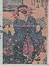
歌舞伎役者や花魁のファッション的存在でもあり、髪型も特徴的。

流行りのアイテム、髪型やアクセサリーにマイクの仕方で、お洒落に夢中なのは現代の女の子だけではありません。今から何百年も前の江戸時代に生きた女性達も、お洒落を楽しんでいました。着物、髪型、化粧にそれぞれ詳しく、く着物編く江戸時代の着るために、お洒落というものを現代の着物とは形が少し違っていました。今は着物も着ることに、文を調製するようになっています。