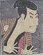
髪が長いのは、髪に油を塗ることで、髪が伸びやすくなるため。