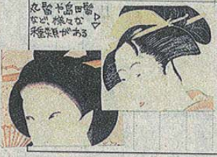
髪型が特徴的、髪飾りも種類がある。

髪型編く「見同じ」に見える髪型が、髪型にも様々な種類があり流行がありました。江戸時代の女性の髪型は数種類もあり、流行を追いかけていた髪型にアレンジしてました。また髪飾りにも様々なデザインがありました。髪型