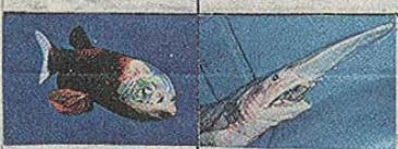
テムニキス ミツクリサメ

第5位 センシナマコ 体はゼリー質で柔らかく半透明のため内臓が透けて見える口の周りにほんの触手があがるように