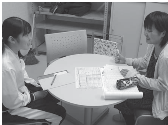
▲東大学習コーチ(4月)

夏休みに、もし家族で旅行される場合は、できたらその中に大学見学も入れてみたらどうでしょうか。卒業生の中には、最初に見た大学が気に入りそのまま入学していく方が多くいました。事前に大学の入試課(大学によって名称が異なります)に連絡を入れておくと、大学案内などがもらえるかも知れません。(山口)